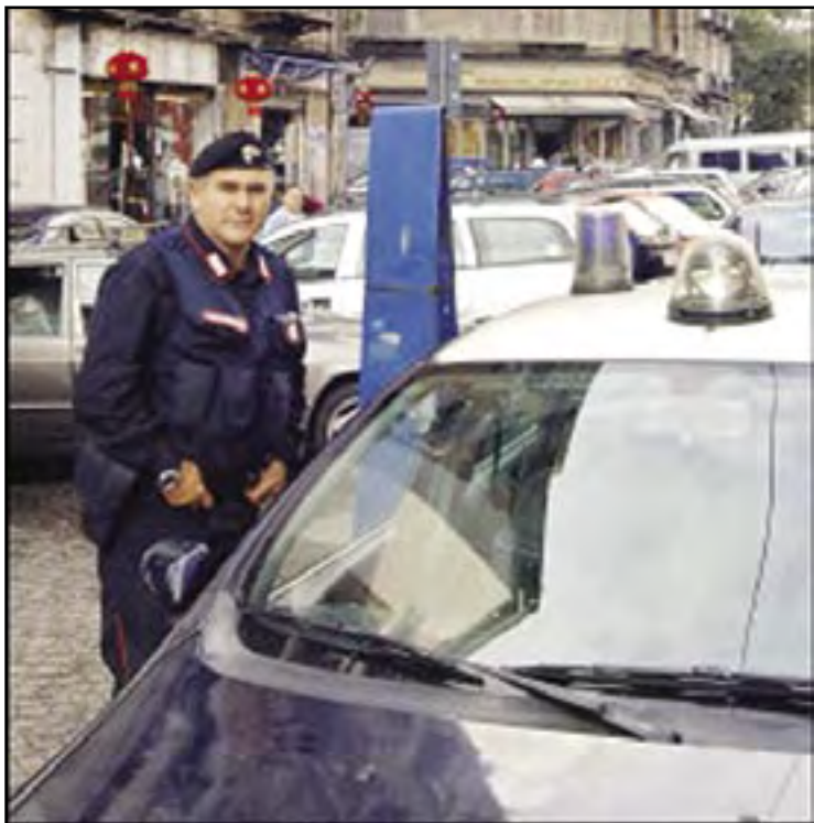
Polisnan anti terrorista Italiano dilanti e edificio naunda a aresta un argelino den sur di Napoles.

ROMA—Italia a lanta preocupa, despues di detencion durante oranan di marduga diahuebs di tres presunto extremista Islamico, califica di “potencialmente operativo” pa comete atentadonan na Europa.